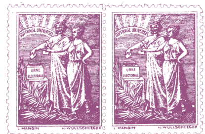
Timbre (factice) prônant le suffrage, commandé par Hubertine Auclert 1906 auprès de Mangin et Wullschieger, Paris, BMD