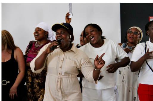
Concert des patientes de l'atelier musico-thérapie

Situation financière critique : Mille Parcours fait appel à la solidarité pour continuer les actions auprès des femmes exilées ayant vécu des violences